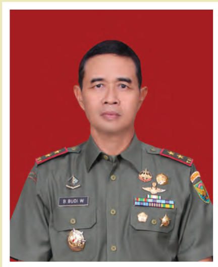
Oleh: Mayjen TNI Bambang Budi Waluyo. YP (Pangdam II/Sriwijaya)

Secara etis, dinamika politik di Indonesia saat ini relatif belum terlaksana dengan baik dan atau se-ideal mungkin. Kondisi ini tercermin melalui kemunculan berbagai isu negatif atau black campaign yang menjadi strategi politik salah satu pihak untuk menjatuhkan lawan politiknya.