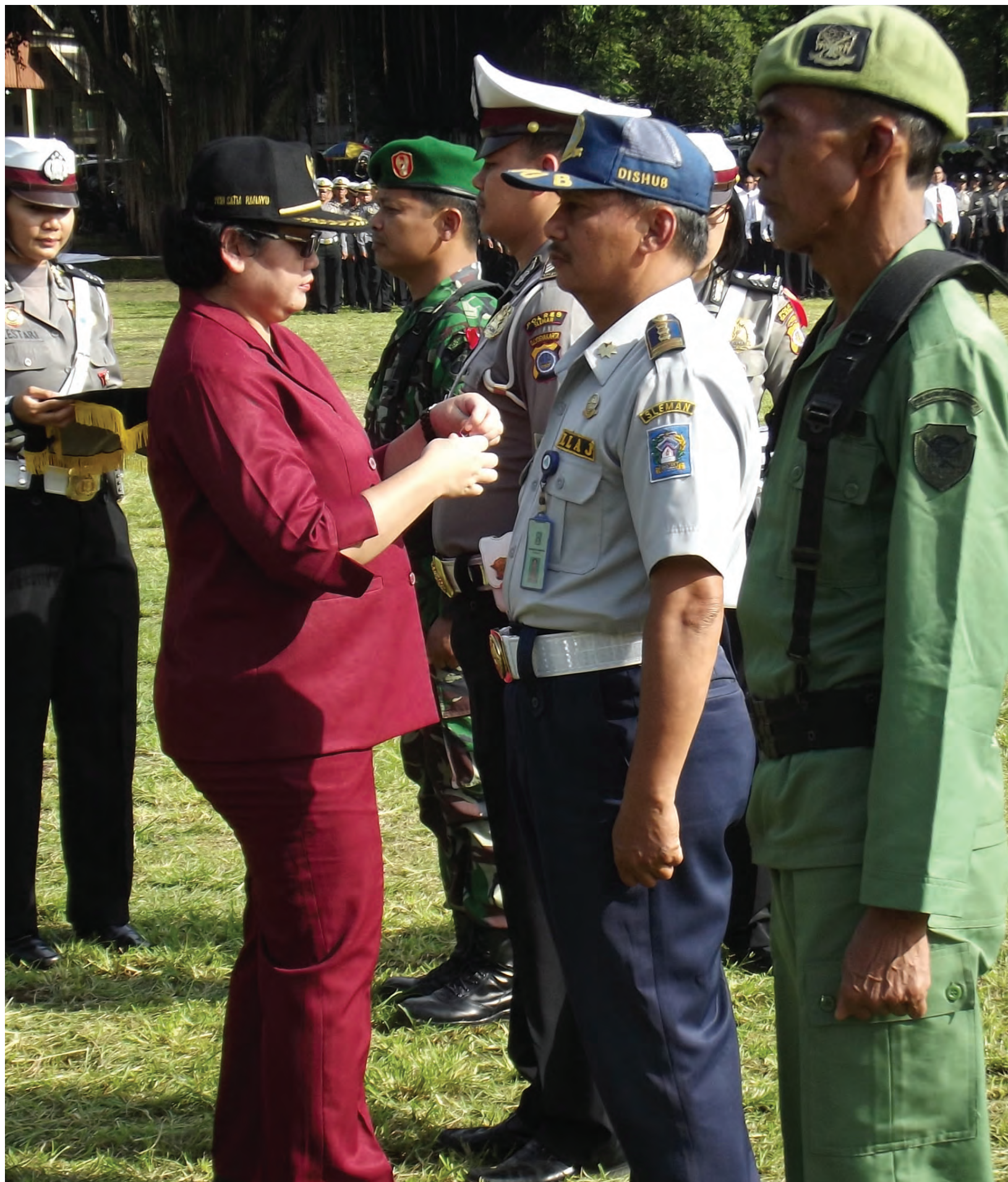
Apel Konsolidasi, Gelar Pasukan dan Latihan Sispamkota dalam rangka mendukung Operasi Mantap Brata Progo 2014 di Sleman, 7 Februari 2014