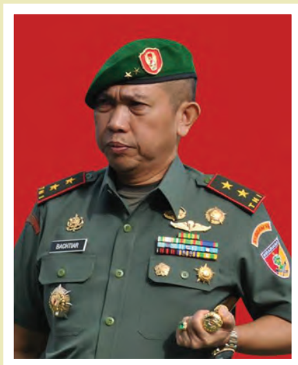
Oleh : Mayjen TNI Bachtiar, S.IP, M.AP (Pangdam VII/Wirabuana)

Dinamika perkembangan tata kehidupan masyarakat dewasa ini berkembang dengan sangat pesat dan membawa dampak kepada perubahan sikap perilaku masyarakat tidak hanya di lingkup nasional, namun juga telah merambah sampai di tingkat lokal provinsi dan pedesaan. Kondisi tersebut mengakibatkan tantangan tugas Binter oleh Satkowil dalam membantu Pemda kedepan semakin tinggi dan kompleks.