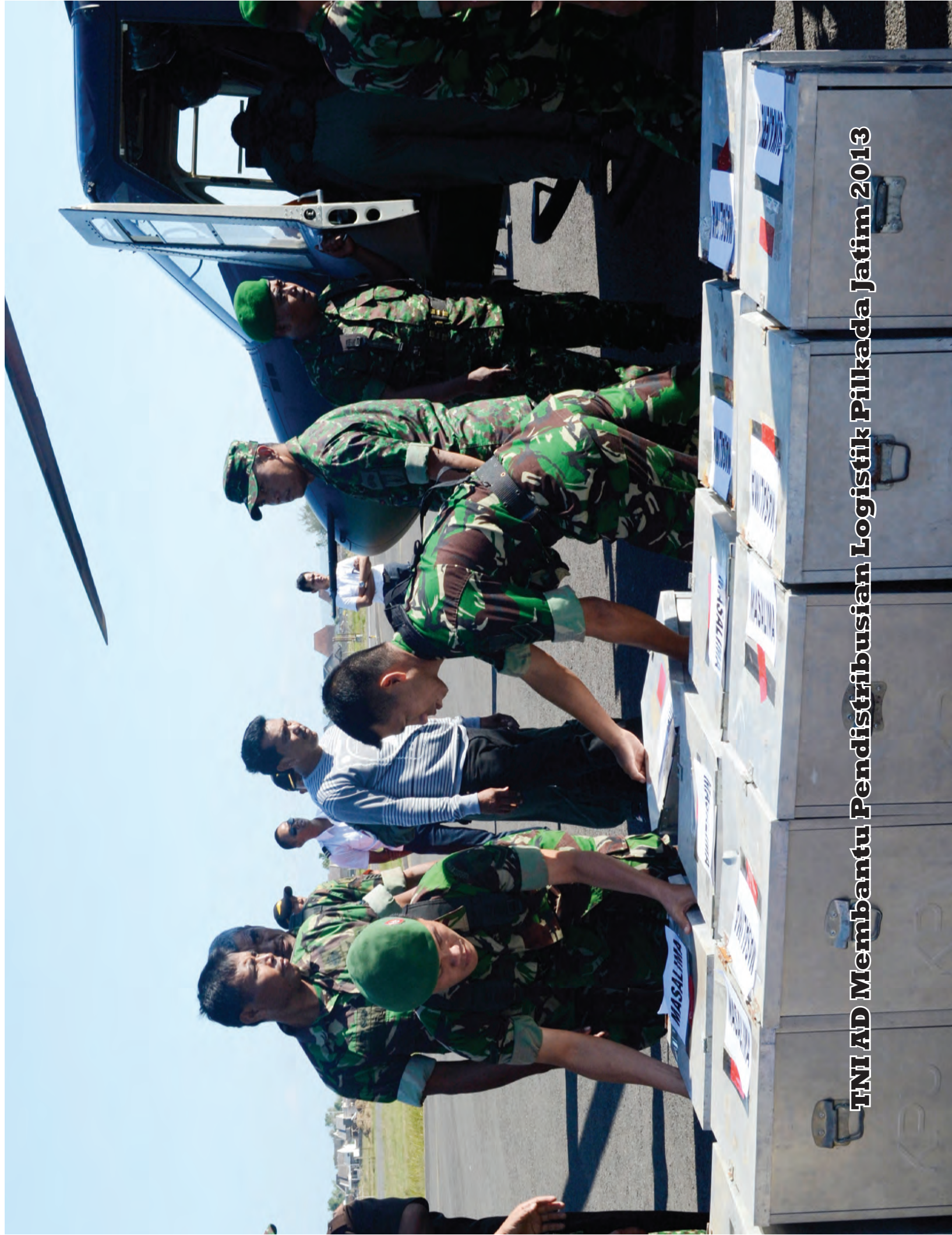
TNI AD Membantu Pendistribusian Logistik Pilkada Jatim 2013