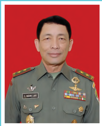
Oleh : Mayjen TNI E. Hudawi Lubis (Pangdam Jaya)

Tahun politik 2014 menyajikan tantangan tersendiri bagi TNI, keberhasilan atau kegagalan dalam pengamanan Pemilu bukan satu-satunya dimensi yang dinilai publik. Lebih dari itu, apresiasi dan kepercayaan publik akan muncul manakala TNI mampu menjaga dan memegang teguh komitmen netralitas selama tahapan pelaksanaannya.