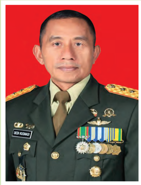
Oleh: Mayjen TNI Dedi Kusnadi Thamim (Pangdam III/Siliwangi)

Konsep Pembinaan Teritorial yang sudah diimplementasikan selama ini, harus dipertahankan dan ditingkatkan terutama dalam menghadapi Tahun Politik 2014 di wilayah. Konsep tersebut hendaknya diselaraskan secara sinergis dengan program penyelenggaraan pemilu