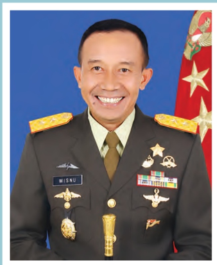
Oleh : Mayjen TNI Wisnu Bawa Tenaya (Pangdam IX/Udayana)

Setiap prajurit harus memiliki komitmen dan kontribusi yang sangat positif di dalam mengawal jalannya pesta demokrasi di Indonesia.